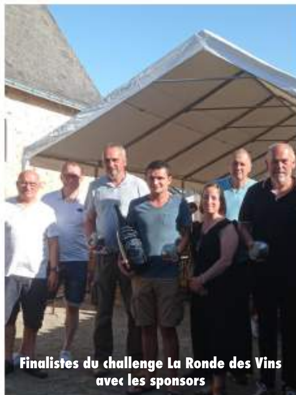
Finalistes du challenge La Ronde des Vins avec les sponsors

Grâce au label « La Société Cœur de Village », l'Association Les Amis Réunis se trouve renforcée dans sa vocation de lieu de rencontre, participant ainsi au maintien du lien social dans nos petits villages.