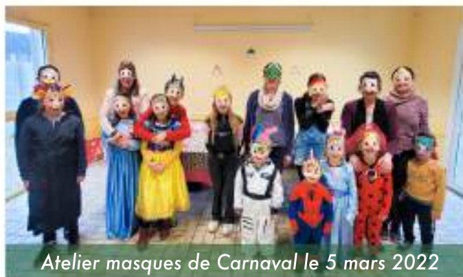
Atelier masques de Carnaval le 5 mars 2022

Création de couronnes ou masques de Carnaval, à chaque fois, nous sommes ravis d'accueillir autant de participants !