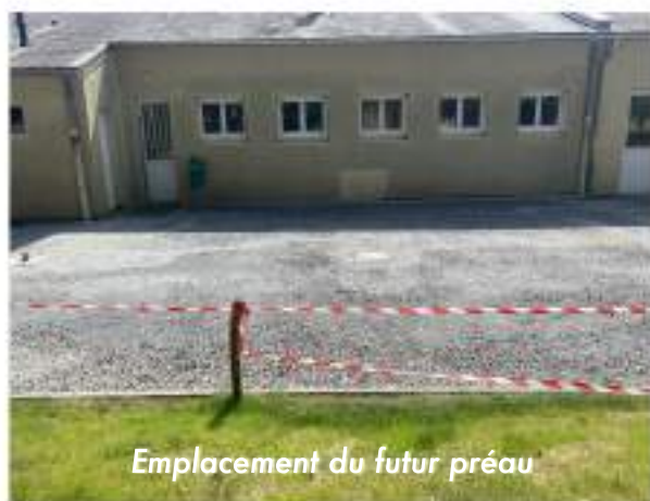
Emplacement du futur préau